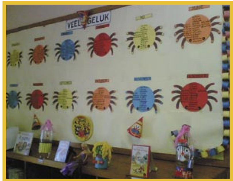
▲ 'n Oorspronklike wyse waarop jong gebruikers besef hulle is nie net 'n nommer nie (Sunnyside Biblioteek)