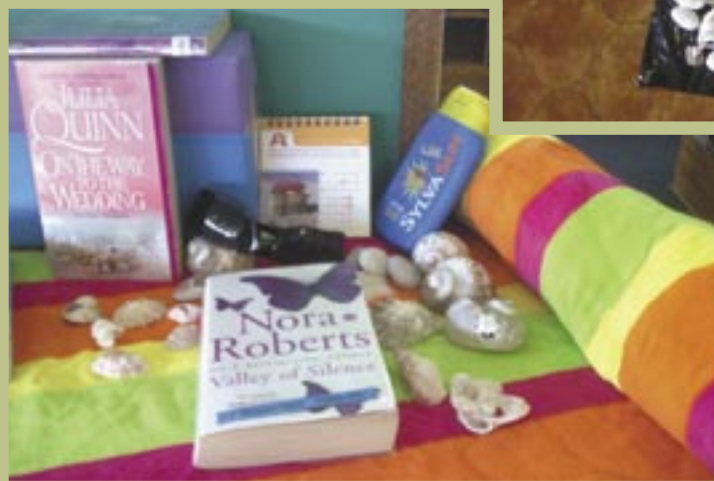
< ^ Vakansietyd! Hierdie kleurvolle uitstallings is gemik op beide volwassenes en kinders (Napier Biblioteek)