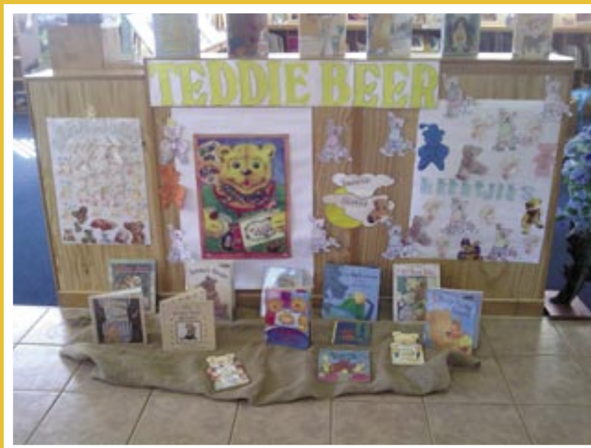
▲ Die teddiebeerplakkaat verskaf deur Provinsie vorm 'n fokuspunt vir hierdie vriendelike beertjie-uitstalling (Zolani Biblioteek)

Nota: Alle foto's is deur Ronel Mouton op haar selfoon geneem. Moderne tegnologie is werlik wonderlik!