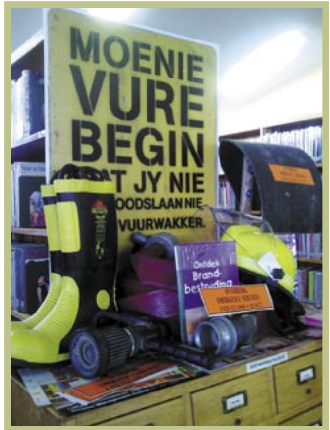
▲ Almal behoort op hierdie belangrike onderwerp attent te wees (Welverdiend Biblioteek)