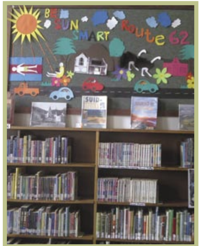
▼ Nog 'n 'warm' gedagte uit Montagu - hier word die populêre 'Roete 62' bevorder