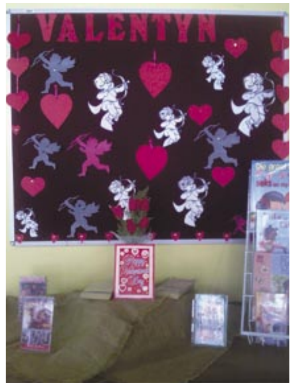
▲ Valentynsdag - altyd 'n populêre tema (Railton Biblioteek)