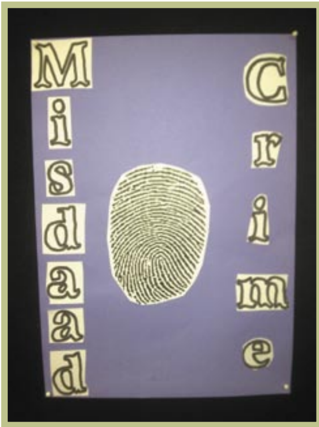
▲ Trefwoorde, 'n vingerafdruk en die misdadaadboodskap kan nie duideliker gestel word nie (Swellendam Biblioteek)