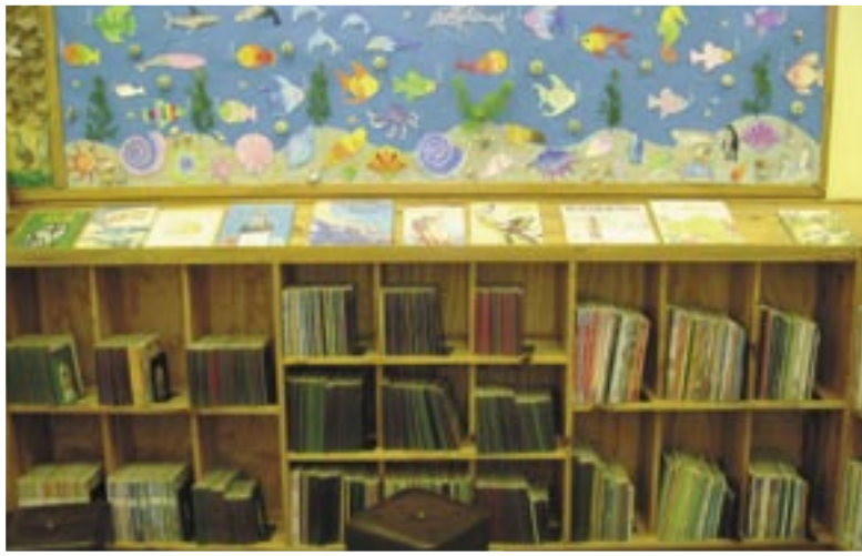
▲ Dit het harde werk gekos om hierdie seelewe-uitstalling te maak (Ashton Biblioteek)

Excellent use of the side of the bookshelf for a Christmas display (Ashton Library) ►