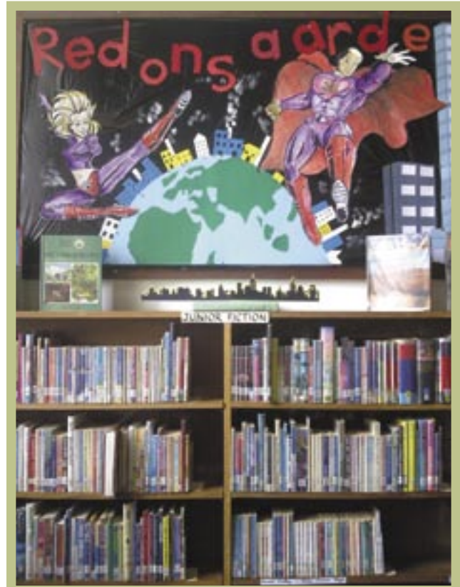
▲ Die gebruik van strookprentkarakters sal jong gebruikers lok om dié belangrike boodskap in te neem (Montagu Biblioteek)