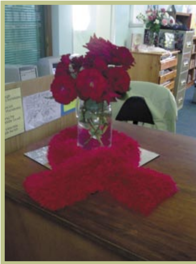
▲ Klem op VIGS. Eenvoudig maar treffend! (Barrydale Biblioteek)