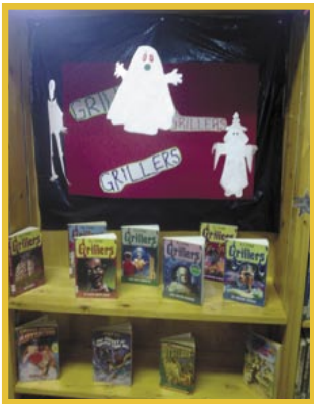
▲ Bevordering van die populêre Griller-reeks (Swellendam Biblioteek)

▼ Uitstekende gebruik van groot, leesbare letterwerk wat netjies vertoon word (Happy Valley Biblioteek)