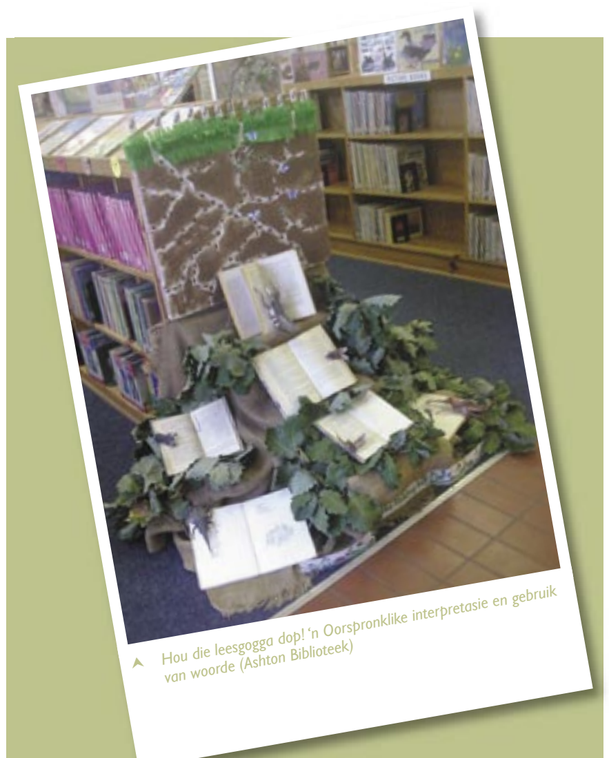
▲ Hou die leesgogga dop! 'n Oorspronklike interpretasie en gebruik van woorde (Ashton Biblioteek)

En op hierdie noot, ook 'n groot dankie aan die talle ander biblioteke wat gereeld gedurende die jaar vir ons voorbeelde van uitstallings stuur. Dit dien as inspirasie, nie net vir ons nie, maar ook vir u kollegas om te sien wat gedoen kan word ten spyte van die druk waaronder almal tans verkeer.