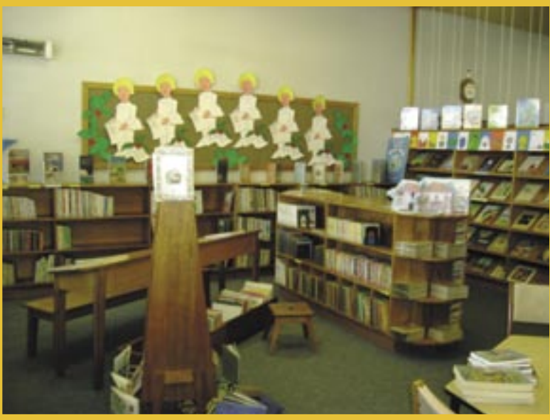
▲ Engeltjies waak oor die kinderafdeling in Robertson Biblioteek

Die herfs- en winteruitstalling laat 'n mens behoorlik brrrr! (Robertson Biblioteek) ➤