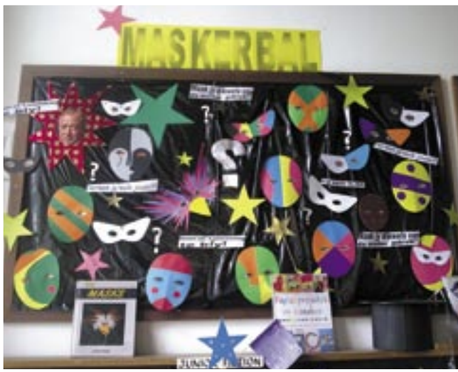
▲ 'n Treffende uitstalling wat handwerk aanmoedig (Montagu Biblioteek)