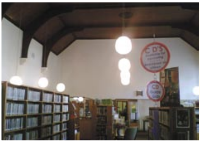
▲ Slim gebruik van bewertjies (Montagu Biblioteek)