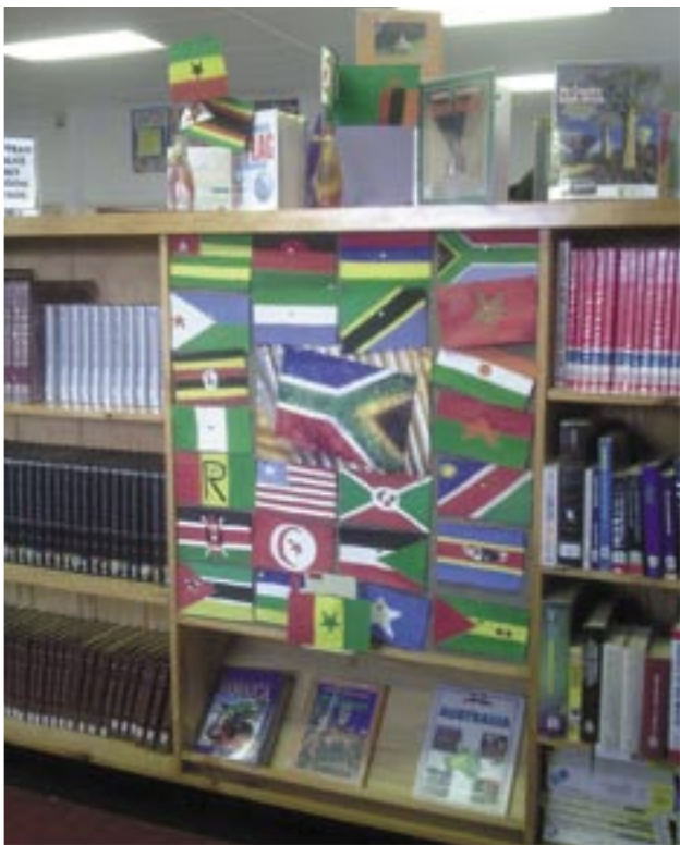
▲ 'n Deel van die boekrak word gebruik vir hierdie leersame uitstalling. Let op die gebruik van 'n plakkaat wat ook jare gelede aan biblioteke verskaf is (Nuwerus Biblioteek)