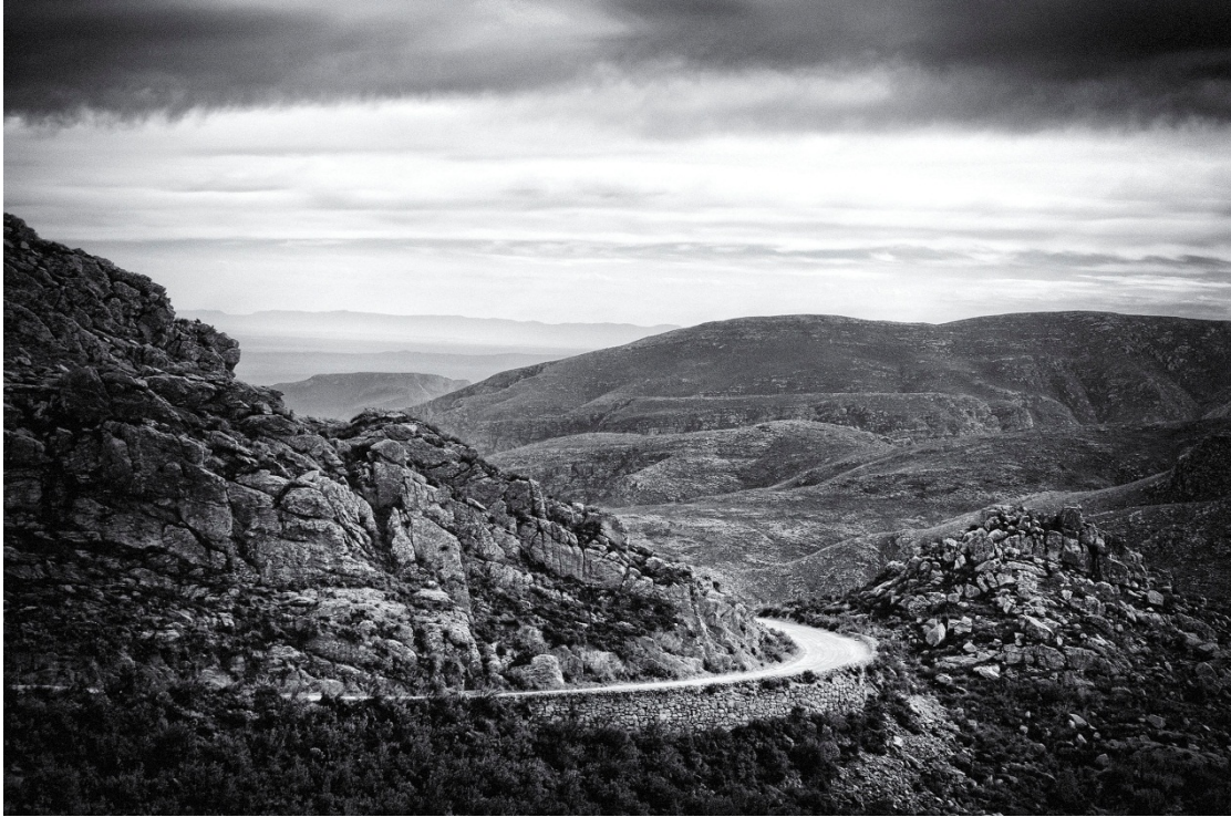
Swartbergpas - provinsiale erfenisterrein